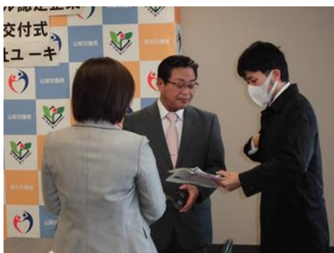
山梨日日新聞が取材に来ました。