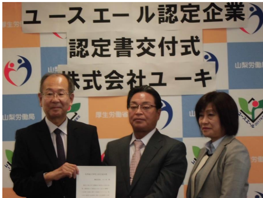
能坂局長（左）と 小泉代表取締役社長、小泉取締役専務

山梨労働局は若者雇用促進法に基づき「株式会社 ユーキ」を平成28年度第3号認定企業と決定し、平成29年3月28日（火）に認定式を行いました。