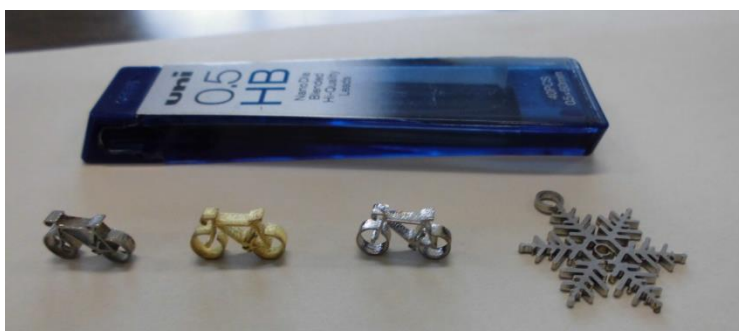
それぞれが1cmほどの自転車。自立しています！

ユースエール認定企業とは若者の採用・育成に積極的で、若者の雇用管理が優良な中小企業を厚生労働大臣が認定する制度です。認定した企業に対して情報発信を後押しすることなどによって、企業が求める人材の円滑な採用を支援し、求職中の若者とのマッチングの向上を図ります。